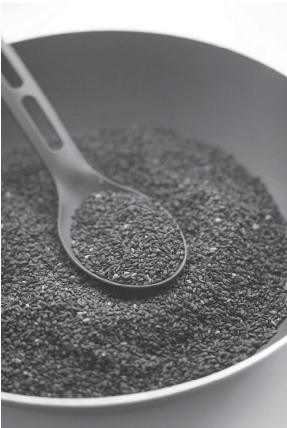
ရေးသွင်းပြီး တာဝန်ခံနှင့် အတည်ပြုရမည့်ပုဂ္ဂိုလ်များ လက်မှတ်ရေးထိုးထားရမည်ဖြစ်ပါတယ်။

နောက်တစ်ချက်ကတော့ စိုက်ပျိုးပွဲ မျိုးစေ့ဖြစ်ပါတယ်။ ပြည်ပပို့ကုန်ဈေးကွက်ဝင် ဈေးကောင်းရတဲ့မျိုးဖြစ်ဖို့လိုအပ်ပါတယ်။ နှမ်းမျိုးစေ့သည် အပင်ပေါက်နှုန်း ၈၅ ရာခိုင်နှုန်းအထက်ရှိပြီး မျိုးကောင်းမျိုးသန့်ဖြစ်ဖို့လိုအပ်ပါတယ်။ ဒေသရေမြေ ရာသီဥတုနဲ့ ကိုက်ညီပြီး ရာသီဥတုဒဏ်၊ ပိုးမွှားရောဂါဒဏ်၊ မျိုးစေ့ဆောင်ရောဂါကင်းတဲ့ မျိုးဖြစ်ဖို့ လိုအပ်ပါတယ်။ ဒါတွေဟာ ဓာတ်ခွဲခန်းမှာ စစ်ဆေးရမယ့် အချက်များ ဖြစ်ပါတယ်။ ရရှိလာတဲ့မျိုးရဲ့ ရရှိလာတဲ့ဒေသ၊ မျိုးအမည်၊ မျိုးရာဇဝင်၊ မျိုးဗီဇသန့်စင်မှု၊ ရရှိလာတဲ့နေ့ရက်၊ ရရှိလာတဲ့ ပမာဏ၊ ထပ်ဆင့်လက်ခံစိုက်ပျိုးမည့်သူ အမည်များကို သတ်မှတ်ပုံစံတွင် မှတ်တမ်း