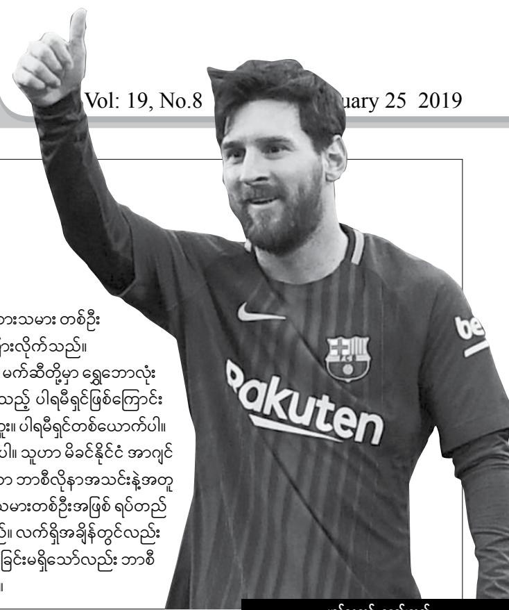
ဟန်နေသစ် စုစည်းသည်

ဘာစီလိုနာတိုက်စစ်မှူး မက်ဆီသည် သူမတူအောင် ထူးချွန်သည့် ပါရမီရှင် ကစားသမား တစ်ဦး ဖြစ်ကြောင်း ရိုးရဲလ်မက်ဒရစ်အသင်း နည်းပြဟောင်း ဖေဘီယိုကာပယ်လိုက ပြောကြားလိုက်သည်။ ကာပယ်လိုက ဂျပင်တပ်အသင်းမှ ပေါ်တူဂီတောင်ပံကစားသမား စီရိုနယ်ဒိုနှင့် မက်ဆီတို့မှာ ရွှေဘောလုံးဆုကို ငါးကြိမ်စီ ရရှိထားကြသော်လည်း စီရိုနယ်ဒိုထက် မက်ဆီမှာ မွေးရာပါထူးချွန်သည့် ပါရမီရှင်ဖြစ်ကြောင်း ထုတ်ဖော်ပြောဆိုခဲ့ခြင်းဖြစ်သည်။ ကာပယ်လိုက 'မက်ဆီဟာ ဘောလုံးသမား မဟုတ်ဘူး။ ပါရမီရှင်တစ်ယောက်ပါ။ ကမ္ဘာ့ဘောလုံးလောကမှာ သူဟာ အပြောင်မြောက်ဆုံး၊ အထူးချွန်ဆုံးသူတစ်ယောက်ပါ။ သူဟာ မိခင်နိုင်ငံ အာဂျင်တီးနားအသင်းနဲ့ အောင်မြင်မှုဆီလို့ ငွေတံဆိပ်ဆုတောင်မရဖူးပါဘူး။ ဒါပေမဲ့ မက်ဆီဟာ ဘာစီလိုနာအသင်းနဲ့အတူ ဆုဖလားတွေ အမြောက်အမြား ရယူထားနိုင်ပြီး ကမ္ဘာ့အကောင်းဆုံး ဘောလုံးကစားသမားတစ်ဦးအဖြစ် ရပ်တည်နေပါတယ်။ သူ့ရဲ့ခြေစွမ်းကို ဘယ်ကစားသမားမှ လိုက်မမီနိုင်ပါဘူး' ဟု ပြောကြားသည်။ လက်ရှိအချိန်တွင်လည်း မက်ဆီသည် မိခင်နိုင်ငံ အာဂျင်တီးနားအတွက် အောင်မြင်မှုတစ်စုံတစ်ရာ ရယူပေးနိုင်ခြင်းမရှိသော်လည်း ဘာစီလိုနာအသင်းအတွက်မူ မရှိမဖြစ် အရေးပါနေဆဲ ကစားသမားတစ်ယောက်ဖြစ်သည်။